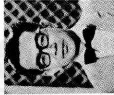
慶応義塾体育会 バドミントン部会長